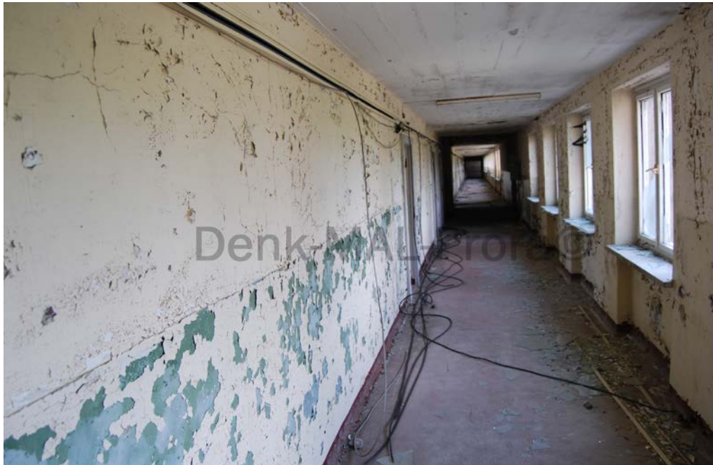
Blick ins Treppenhaus 5

Weiter auf dem Flur Richtung TH 5. Unter der hellen Wandfarbe der 1980er Jahre kommt der dunkelgrüne Sockel aus der Zeit des MSR-29 zum Vorschein.