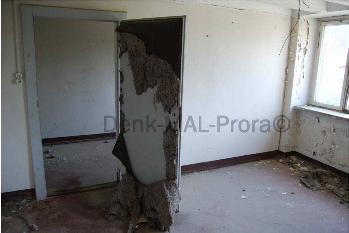
Blick aus dem Fenster: