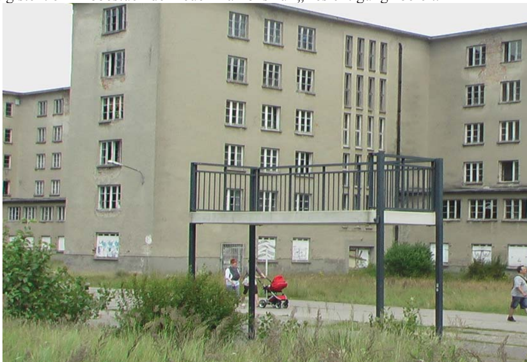
Balkonelement vor Block 2 landseitig; Quelle Privatfoto des Verfassers Juli 2012