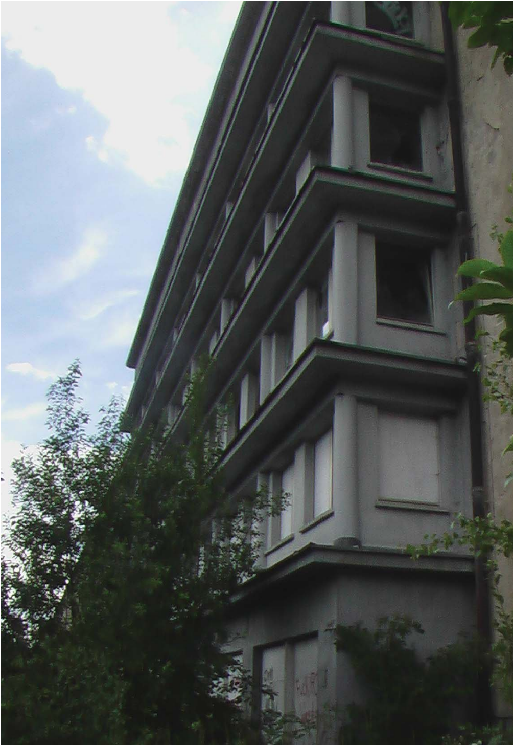
Seeseitiger Ausbau der Liegehallen beim Block 1

Im Treppenhaus fallen sofort die schmiedeeisernen Geländer auf. Die Treppenstufen müssen mit Teppichen bedeckt gewesen sein. In den Ecken zwischen den Stufen sind noch links und rechts jeweils noch die Ösen zu erkennen, die als Befestigung der Teppichspann-Stangen dienten.