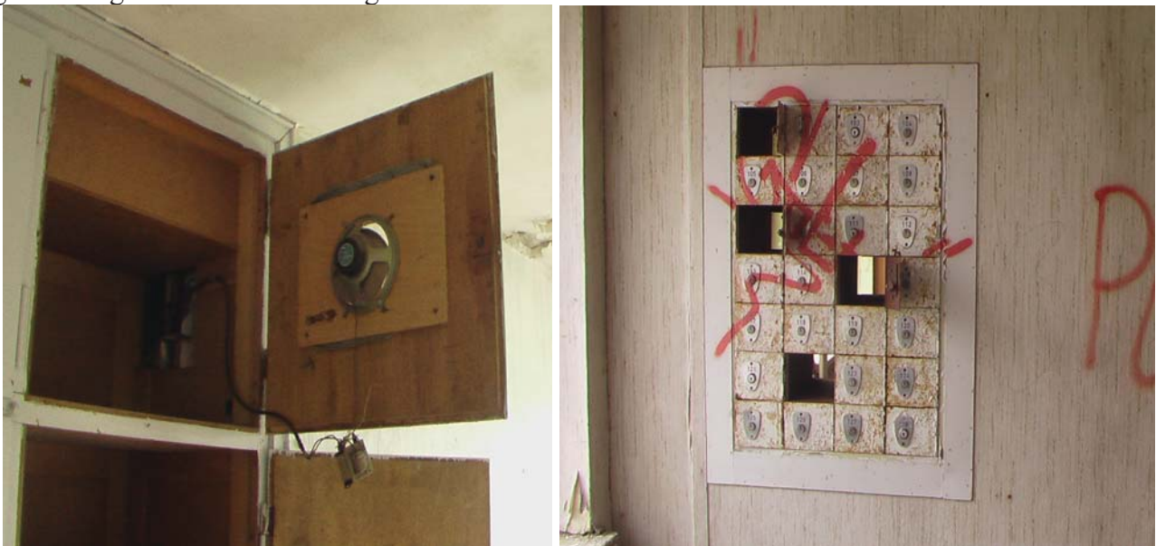
Einbaulautsprecher und Postschließfächer im Block 1; Quelle Privatfotos des Verfassers Juli 2012

In allen Zimmern mit Einbauschränken sind noch die Lautsprecher zu finden. Beschallung den ganzen Tag? Eine Poststation sogar mit den Postschließfächern ist noch zu finden.