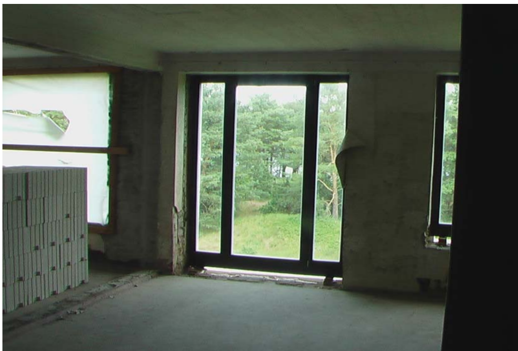
Ostseeblick durch die neuen Balkontüren

Innen zeigt sich dann der tatsächliche Stand der Umbauten. Beispielhaft wurde die seeseitige Fensterfront so umgebaut, daß ein Eindruck der zukünftigen Aussicht entsteht.