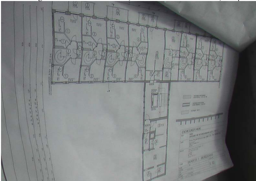
Bauzeichnung zum Block 2; Quelle Privatfoto des Verfassers Juli 2012