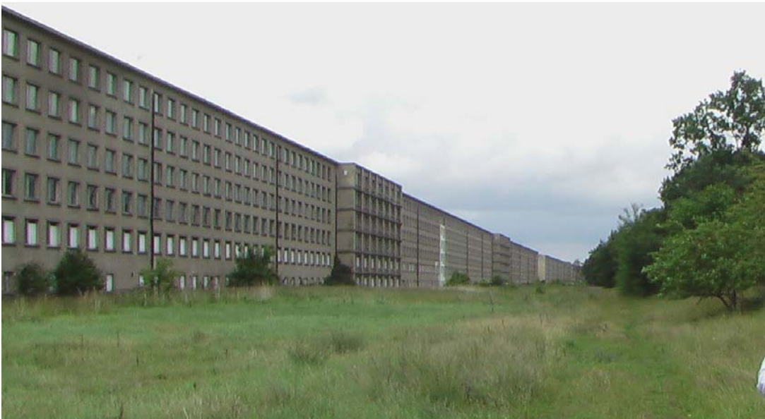
Blick seeseitig am Block 2 entlang, im Hintergrund Block 3; Quelle: Privatfoto des Verf. Juli 2012

Bei genauerem Hinsehen entdeckt man schon aus der Ferne ein helles Stück Fassade, seeseitig fast genau auf der Hälfte des Block 2.