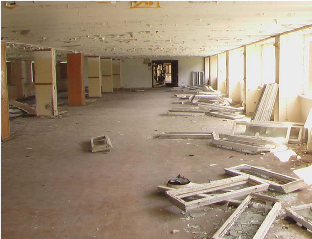
Einer der Speisesäle im Block 1 über die gesamte Tiefe des Gebäudes; Quelle. Privatfoto des Verfassers Juli 2012

Auf jeder Etage muss ein Speisesaal vorhanden gewesen sein. Ebenso eine Küche mit Speisefahrstühlen über alle Ebenen. Das deutet auf eine Hauptküche mit mehreren Endküchen bzw. Essensausgaben hin.