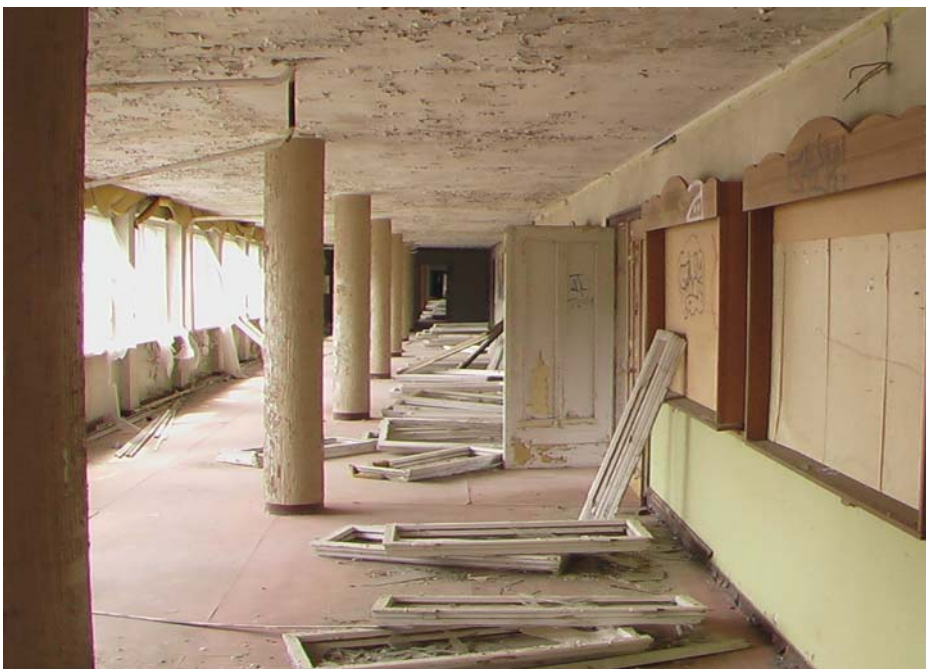
Flur im ersten Stock des Block 1; Quelle: Privatfoto des Verfassers Juli 2012

Im ersten Stock die medizinische Betreuung für die erholungssuchenden NVA-Offiziere, sozusagen ein Med-Punkt auf anderem Niveau. Den gesamten Flur entlang gab es Schaukästen mit wohl verschiedensten Aushängen.