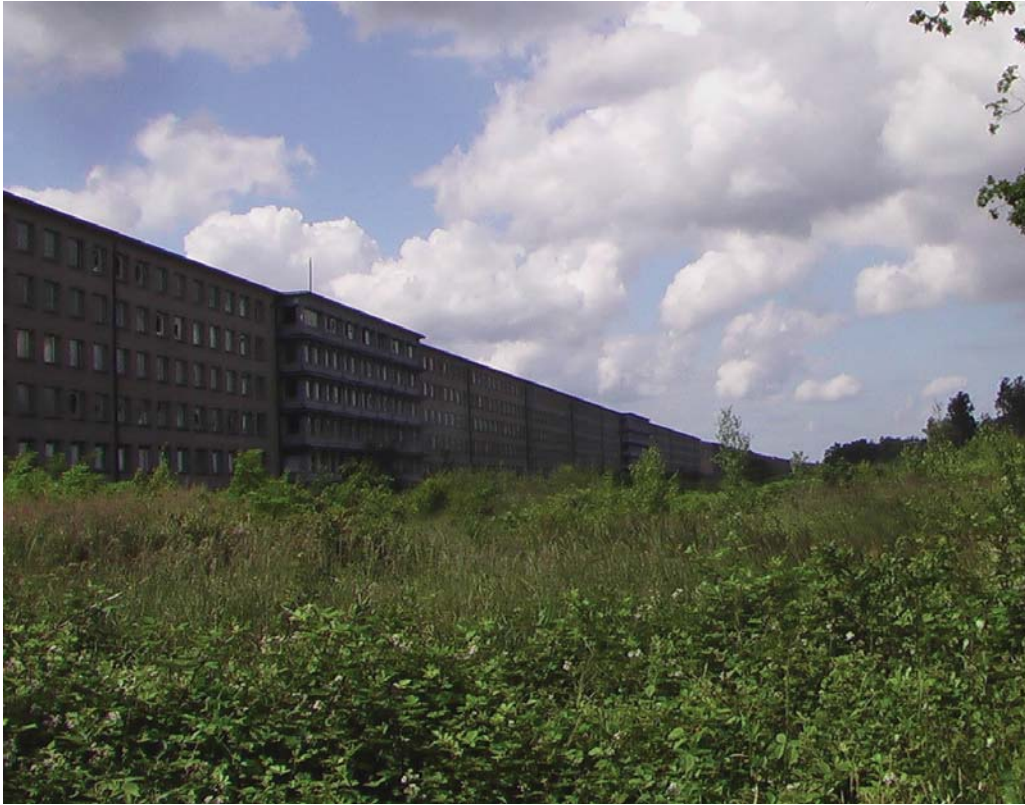
Seeseitiger Blick von Block 1 zu Block 2

Bei genauerem Hinsehen entdeckt man schon aus der Ferne ein helles Stück Fassade, seeseitig fast genau auf der Hälfte des Block 2.