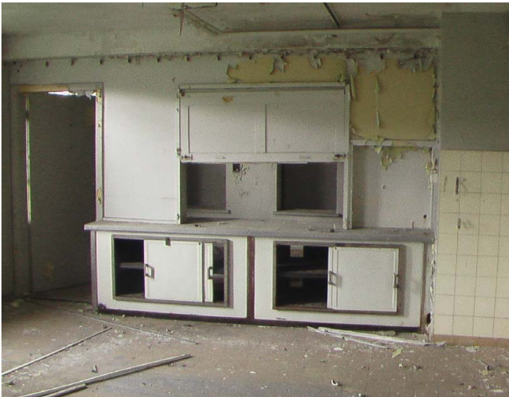
Küche mit Durchreiche und Speise-Aufzüge im Block 1