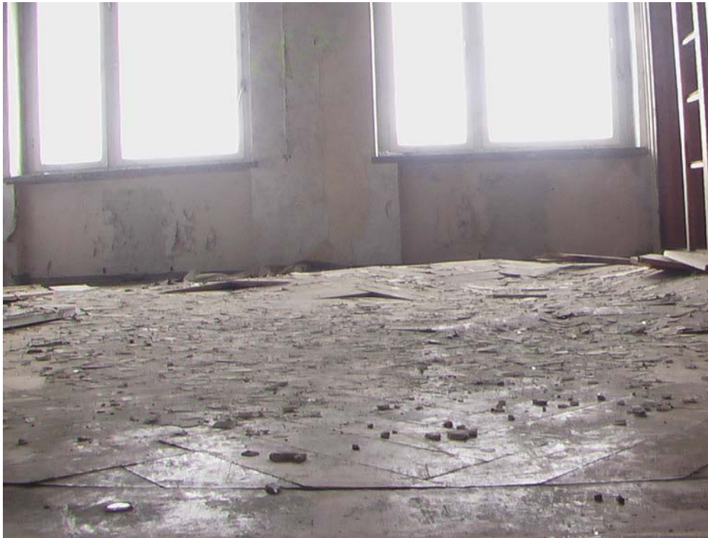
Parkett im Block 1

Die Räume im Block1 sind teilweise mit Parkett ausgestattet. Nach den vielen Wintern mit kaputten Fenstern wölbt es sich in den verschiedensten Formen.