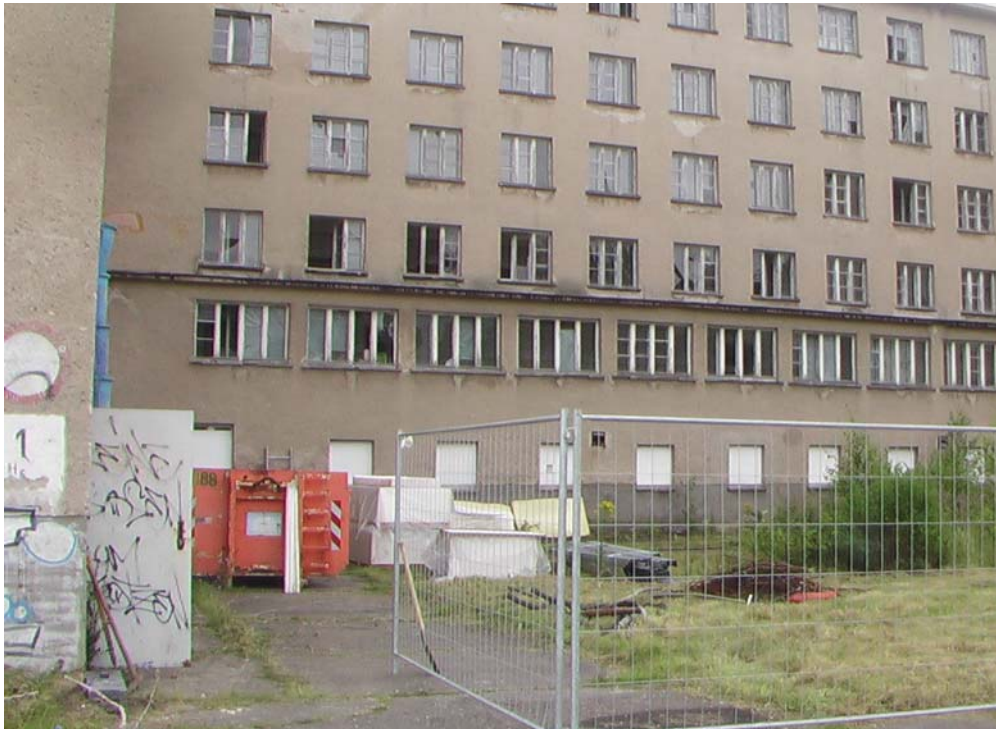
Bauzäune und Container am Block2 ; Quelle Privatfoto des Verfassers Juli 2012

Und auch Bauarbeiter sind vereinzelt zu sehen. Zumindest die unvermeidlichen Baucontainer und kleineren Baufahrzeuge sind eingetroffen. Aus dem Block sind dumpfe Geräusche zu hören. Schlägt der Wind die Türen und Fenster? Dies kann man hier häufig hören und fast an Geister in den Blöcken denken. Oder haben die Bauarbeiter den großen Hammer im Einsatz, um so manche störende Zwischenwand aus der Vergangenheit zu entfernen?