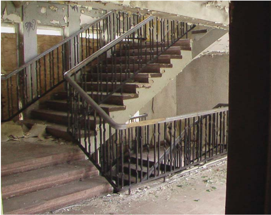
Treppenhaus im Block 1; Quelle Privatfoto des Verfassers Juli 2012

Im ersten Stock die medizinische Betreuung für die erholungssuchenden NVA-Offiziere, sozusagen ein Med-Punkt auf anderem Niveau. Den gesamten Flur entlang gab es Schaukästen mit wohl verschiedensten Aushängen.