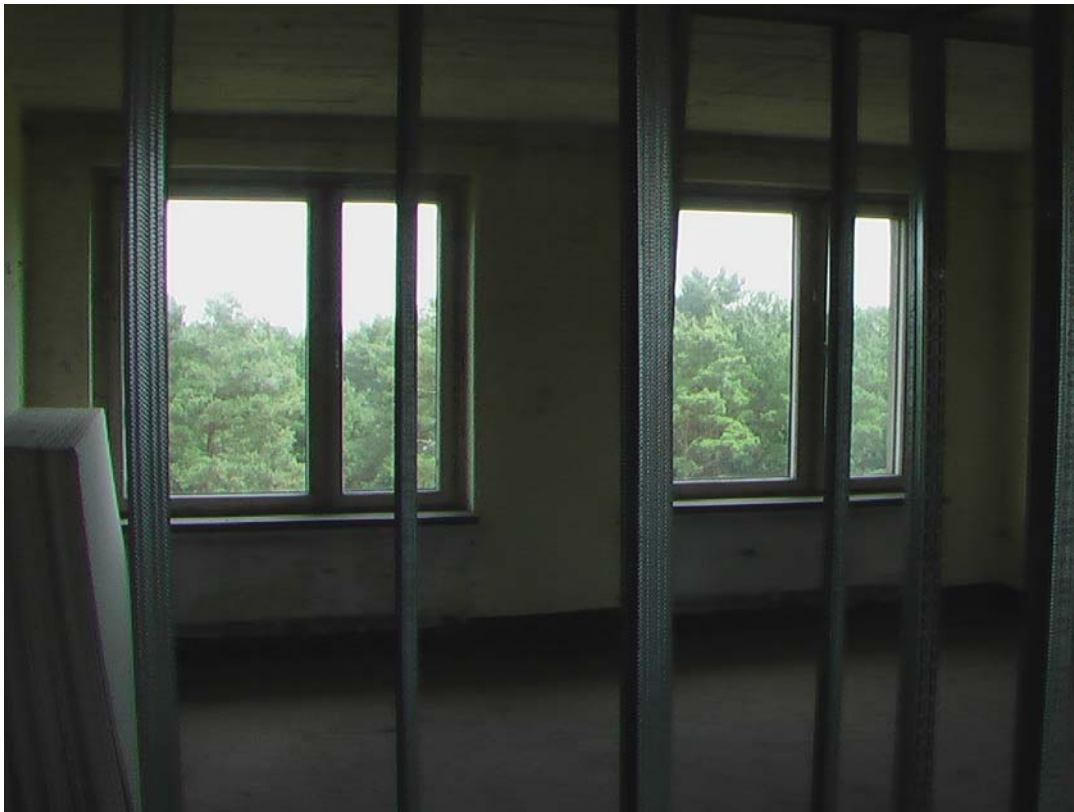
Die ersten Ständerwände wurden gesetzt; Quelle Privatfoto des Verfassers Juli 2012

Die Zimmeraufteilung ist bereits mit Ständerwänden so gestaltet, daß vielleicht den möglichen Investoren mehr als nur das alte, zusätzlich durch Vandalismus verunstaltete; Innenleben gezeigt werden kann.